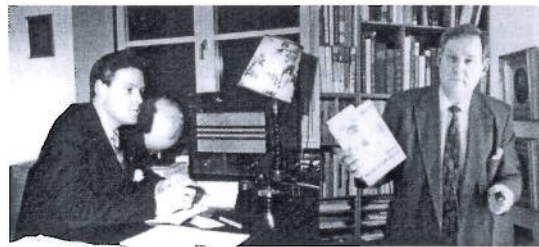
CWE årgång 53, -90

För egen del har jag haft stort utbyte av Vännernas verksamhet genom det kamratskap som utvecklats inför planering av Vännernas årsmöte i samband med DX Parlamenten, det kan gälla DX Auktionerna, som har utvecklats till en ren "hit" eller möjligheterna att föra lite informella samtal på DX Vännernas årsmöten. Jag har själv använt det till att berätta lite om EDXC och internationella DX frågor, hålla kontakten med stationsrepresentanterna och alla gamla återfalls DX are.